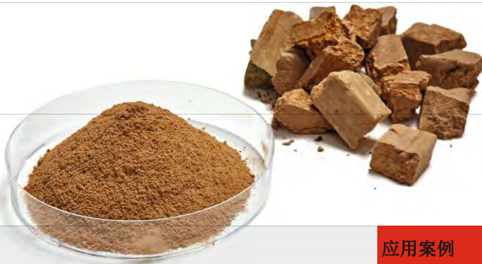
使用行星式球磨机 PULVERISETTE 5 加强型制备最佳的土壤样品