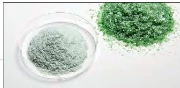
使用微型行星式球磨机 PULVERISETTE 7 加强型研磨玻璃之前和之后的情况