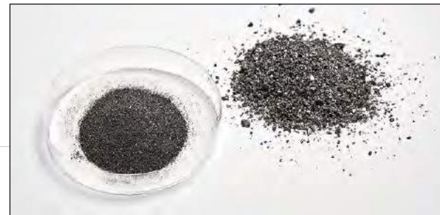
使用行星式球磨机 PULVERISETTE 5 加强型研磨铁钨之前和之后的情况